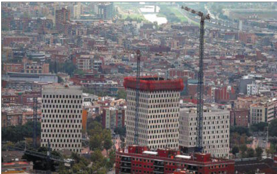
Proyecto Cubics, en Santa Coloma de Gramenet.