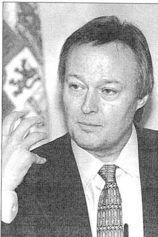
El ministro de Industria y Energía, Josep Piqué.

El 90% de los aparatos va dirigido a las distribuidoras de energía